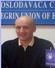
potpredsjednik za privredni i pravni sistem, Predrag Drecun