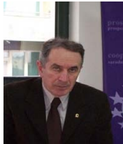
potpredsjednik za socijalni dijalog, Momilo Popović