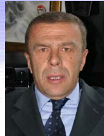
predsjednik Skupštine, Duško Lalić